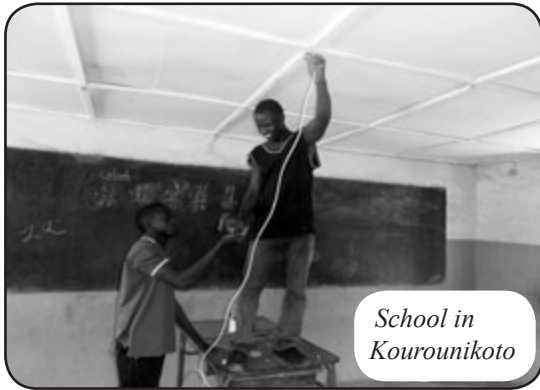
School in Kourounikoto

Het project van de Jumelage om licht te brengen in de dorpen van de Cercle van Kita, door het plaatsen van zonnepanelen op scholen en maternités (=gezondheidscentra) nadert zijn einde.