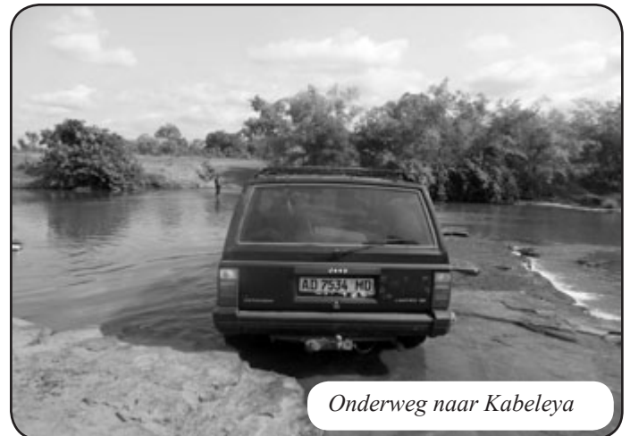
Onderweg naar Kabeleya